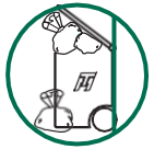
Mantenga las tapas cerradas